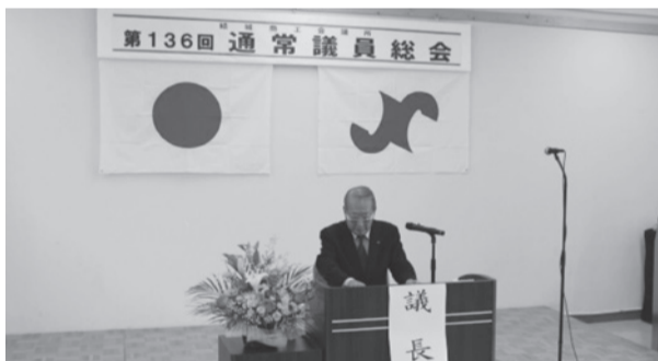
▲議長を務める奥澤会頭

その他、会員拡大運動を始め、共済推進活動、雇用対策事業、勤労者福祉対策事業、さらに、中小企業相談所事業にあっては、経営に大きな影響を受けている中小・小規模事業者を対象に「特別経営相談窓口」を設置し、金融・資金繰り相談、販路拡大等の相談をはじめ、経営全般の相談・支援に対応した。また、「インボイス制度」や「パートナーシップ構築宣言」への登録指導、「起業・創業支援事業」「IT人材育成事業」「企業交流による移住促進活動事業」「結城市プレミアム付き商品券発行事業」など変化の激しい中小・小規模企業施策にもいち早く相談、支援ができるよう対応した。