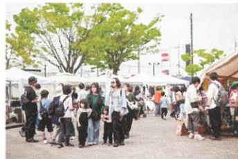
約80の出店者が並んだマーケットエリア