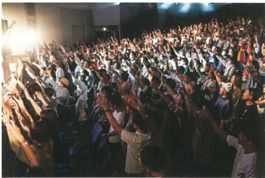
音楽ライブで盛り上がる観客（大ホール）

(株)TMO 結城は一般社団法人 MUSUBITO と共催で4月20日、21日、街なか音楽祭「結いのおと」を開催しました。地域まちづくり団体の結いプロジェクトが企画、運営を行っているもので、今年で11回目となる同音楽祭は、結城市民文化センターアクロスと南部中央公園（けやき公園）を会場に、全22組のプロミュージシャンを迎え、外のマーケットには飲食やアートを中心に80店以上が出店し、多くの人でにぎわいました。先日水戸市で開催された全国商工会議所観光振興大会で大賞を受賞したことで注目が集まる中、県内外から約1万人の来場者を迎え晴天の下大盛況のうちに幕を閉じました。近隣の皆様には多大なご理解をいただきありがとうございました。また、運営にご協力いただいた関係者の皆様にも重ねて御礼申し上げます。