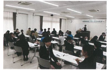
対面で言葉遣いの演習

受講者からは、「社会人としてのマナーを詳しく教えていただいた。今回研修で学んだことを生かし、社会人として一人前になれるようにスキルアップを目指して頑張りたい。」と感想をいただきました。ご参加いただきました事業所の皆様、ありがとうございました。皆様のご活躍を心より祈願しております。