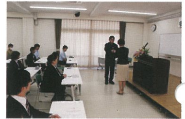
名刺交換にも細かいマナーがある